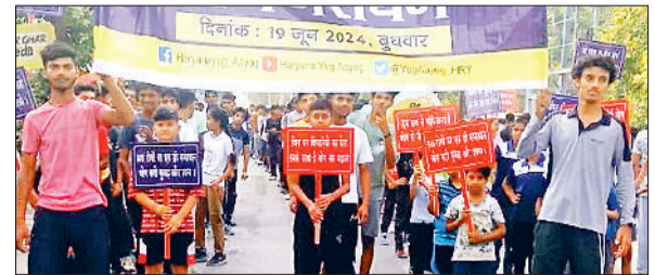
पानीपत। योग दिवस के प्रति जनता को जागरूक करने के लिए मैराथन दौड़ का आयोजन करते हुए युवा वर्ग।