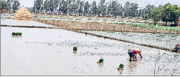
कुरुक्षेत्र। धान की रोपाई करते किसान।

धरतीपुत्र धान रोपाई के लिए खेतों में उतर गए हैं। इस बार एक लाख 25 हजार हेक्टेयर में धान रोपाई की जानी है, जिसके साथ ही 60 लाख क्विंटल धान उत्पादन का लक्ष्य रखा गया है। जिला में करीब 70 फीसद क्षेत्र में पीआर किस्म और लगभग 30 फीसद में बासमती धान की रोपाई की जाती है। किसान पिछले कई दिनों से पूरी तैयारी कर 15 जून का इंतजार कर रहे थे। ऐसे में बुधवार से धान की रोपाई का काम तेज हो गया