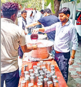
आयोजन करता आ रहा है। अतिरिक्त निगम आयुक्त ने बताया कि नगर निगम आयुक्त अभिषेक मीणा के दिशा-निर्देश में छबील लगाने का आयोजन किया गया था। उन्होंने बताया कि पिछले कई दिनों से भीषण गर्मी के प्रकोप ने आमजन को बेचैन कर रखा है। ऐसे में नगर निगम कर्मचारियों ने हजारों की

नगर निगम आयुक्त अभिषेक मीणा के निर्देश पर निगम क्षेत्र में सम्पत्ति आई.डी. को स्व-प्रमाणित करने का कार्य तेजी से किया जा रहा है। इसके लिए नगर निगम की 20 टीमें सभी वार्डों में डोर टू डोर जाकर प्रॉपर्टी आई.डी. को सत्यापन करने का कार्य कर रही हैं। अब तक 31 हजार 163 सम्पत्तियों को स्व-प्रमाणित किया जा चुका है। जो व्यक्ति सम्पत्ति आई.डी. को स्व-प्रमाणित कर रहे हैं, उन्हें वित्त वर्ष 2024-25 के सम्पत्ति कर पर 10