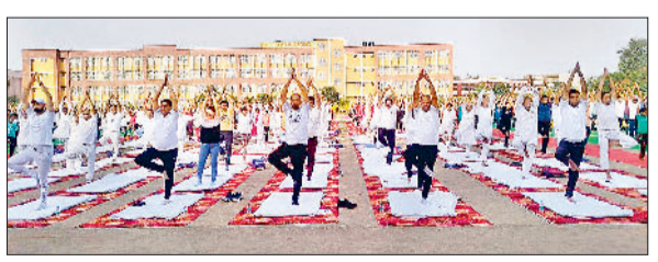
अंबाला। योग की रिहर्सल करते प्रशासनिक अधिकारी व अन्य।