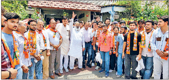
अंबाला। भाजपा में शामिल हुए युवाओं का अभिनंदन करते पूर्व मंत्री अनिल विज।