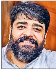
परिवहन मंत्री असीम गोयल, भाजपा

लोकसभा चुनाव संपन्न हो चुका है। सीटों में 5-5 सीटें जीतकर भाजपा- कांग्रेस बराबरी पर आ गई हैं। पिछले दस सालों से राज्य की सत्ता पर काबिज भाजपा के पांच सीटें हारने की वजह से उसके ज्येष्ठ नेताओं व कार्यकर्ताओं का मनोबल टूटा हुआ है। उधर जीरो से पांच सीटों पर आई कांग्रेस को नई ताकत मिली है। उसके कार्यकर्ताओं में पूरा जोश है। इसी वजह से कार्यकर्ता राज्य की सत्ता पर काबिज होने के सपने संजोकर विधानसभा की तैयारी में जुट गए हैं। खासकर दस साल बाद अंबाला लोकसभा सीट पर मिली जीत के बाद अब इसकी नौ विधानसभा सीटों पर दावेदारों की लिस्ट भी