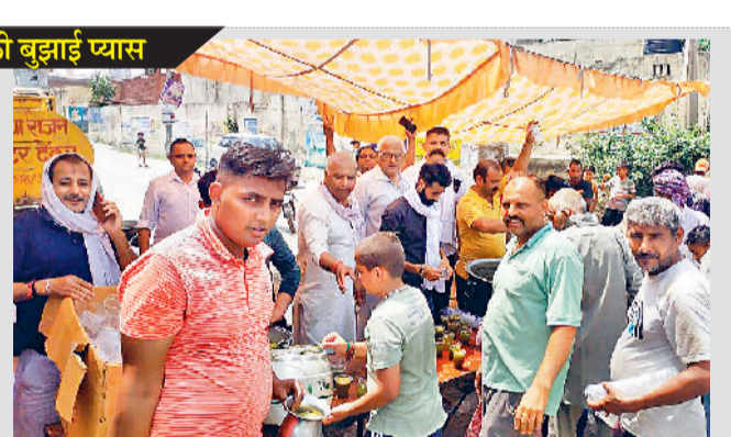
बराड़ा। छबील लगा के पानी पिलते हुए ग्रामीण।