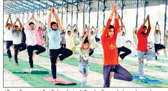
इंदी। इंदी अनाज मंडी इंदी में 10वें अंतरराष्ट्रीय योग दिवस को लेकर योग करते साधक।

अनाज मंडी इंदी में 10वें अंतरराष्ट्रीय योग दिवस के पूर्वार्थ्यस कार्यक्रम में लगभग 250 से अधिक स्कूली बच्चों, महिलाओं, नागरिकों और प्रशासन के अधिकारियों व कर्मचारियों ने योगाभ्यास किया। अंतरराष्ट्रीय योग दिवस की अन्तिम रिहसल के अवसर पर प्रतिभागियों को सम्बोधित करते हुए एसडीएम अशोक कुमार ने कहा कि 21 जून को अनाज मंडी इंदी में ही खंड स्तरीय अंतरराष्ट्रीय योग दिवस समारोह का आयोजन किया जाएगा। उन्होंने बताया कि 21 जून को खंड स्तरीय कार्यक्रम प्रातः 6 बजे योगाभ्यास के प्रोटोकॉल के