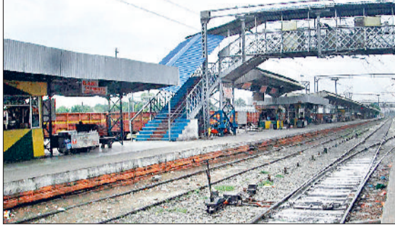
यमुनानगर में बुधवार को दोपहर के समय गर्मी में सुनसान पड़ा जगाधरी रेलवे स्टेशन।

दोपहर के समय सड़कें, रेलवे स्टेशन, बस स्टैंड और बाजार रहने लगे सुनसान