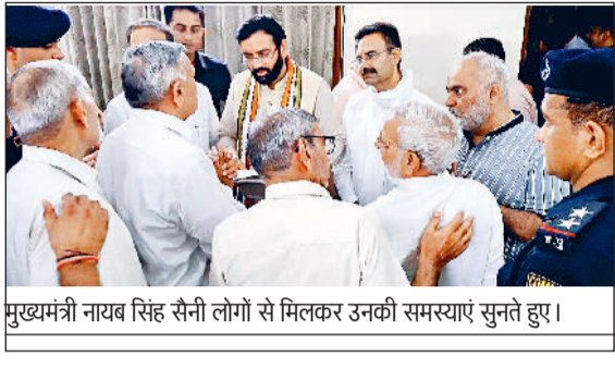
मुख्यमंत्री नाथ सिंह सैनी लोगों से मिलकर उनकी समस्याएं सुनते हुए।

मुख्यमंत्री नाथ सिंह की आम जनता में लोकप्रियता निरंतर बढ़ती जा रही है। जिसका अंदाजा इस बात से लगाया जा सकता है कि करनाल आगमन पर मुख्यमंत्री के स्वागत को लेकर आम जनता