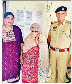
यमुनानगर में हजारों रुपये की स्मैक के साथ गिरफ्तार की गई महिला पुलिस हिरासत में खड़ी हुई।

42.30 ग्राम स्मैक बरामद की है। पुलिस ने आरोपी के