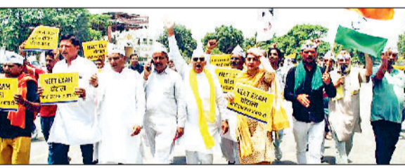
करनाल। आम आदमी पार्टी के कार्यकर्ता नीट परीक्षा में हुई गड़बड़ी को लेकर सड़कों पर उतरकर जोरदार विरोध प्रदर्शन करते हुए।