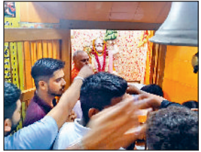
तरावड़ी स्थित हनुमान मंदिर में श्रद्धालुओं की भीड़