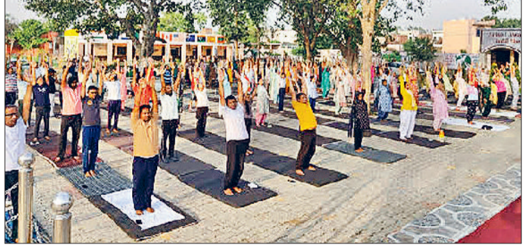
नारायणगढ़। योग दिवस की पायलट रिहर्सल में भाग लेते हुए योग साधक।