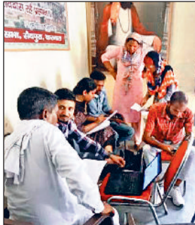
वार्डों में डोर टू डोर जाकर प्रॉपर्टी आई.डी. को सत्यापित करने का कार्य करते कर्मचारी।

नगर निगम आयुक्त अभिषेक मीणा के निर्देश पर निगम क्षेत्र में सम्पत्ति आई.डी. को स्व-प्रमाणित करने का कार्य तेजी से किया जा रहा है। इसके लिए नगर निगम की 20 टीमें सभी वार्डों में डोर टू डोर जाकर प्रॉपर्टी आई.डी. को सत्यापन करने का कार्य कर रही हैं। अब तक 31 हजार 163 सम्पत्तियों को स्व-प्रमाणित किया जा चुका है। जो व्यक्ति सम्पत्ति आई.डी. को स्व-प्रमाणित कर रहे हैं, उन्हें वित्त वर्ष 2024-25 के सम्पत्ति कर पर 10